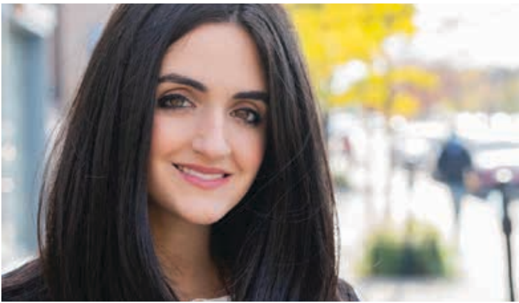
إيمانويلا لامبروبولوس النائب الفدرالي عن دائرة سان لوران

لكن هناك ما هو أقوى من ذلك لتحقيق الضغط وتعديل السياسات ونشر الوعي، نحن لا نقتل من شأن المسيرات والخروج للشارع وهو مطلوب وضروري وسيستمر، ولكن تأثيره محدود بالأحداث القوية على الأرض، وعندما يصمت الترشق ينخفض تأثيره، ويزداد الضرورة لحملات الضغط والتوعية والتي تستمر ضرورتها قبل الترشق وخلال الترشق وعندما تهدأ جبهات القتال، لأنه ولتوقف القصف فإن المأساة لم تنتهي بعد، لذا فالحملة مازالت مستمرة فجراء المداومة معنا من أجل أهلنا وحققنا.