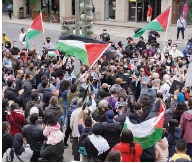
الشباب عنصر اساسي في التظاهرات في كندا

السبق الصحفي وللبعد الداخلي لهذه الفعاليات . ومع توالي المآسي التي كانت تجري وسقوط الأطفال والنساء و التدمير الواسع للبنان ، بدأت الحقائق المريرة على أرض غزة تفرض نفسها وذلك بالرغم من استمرار تبني الرواية " الاسرائيلية " ، و لكن التكلفة الانسانية على للحرب لم يعد بالإمكان تجاهلها ببساطة .