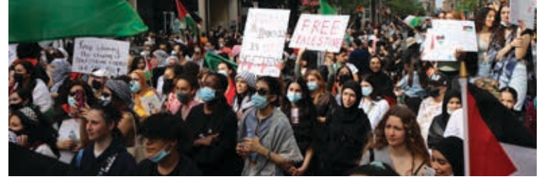
الشباب عنصر اساسي في التظاهرات في كندا

الفاضة لتماسك المجتمع الاسرائيلي في دولة مركزية لها حضور في واقع المنطقة ومستقبلها رغم الحشود التي يعمل لها بن سلمان وبن زايد وغيرهم من "البدو"!