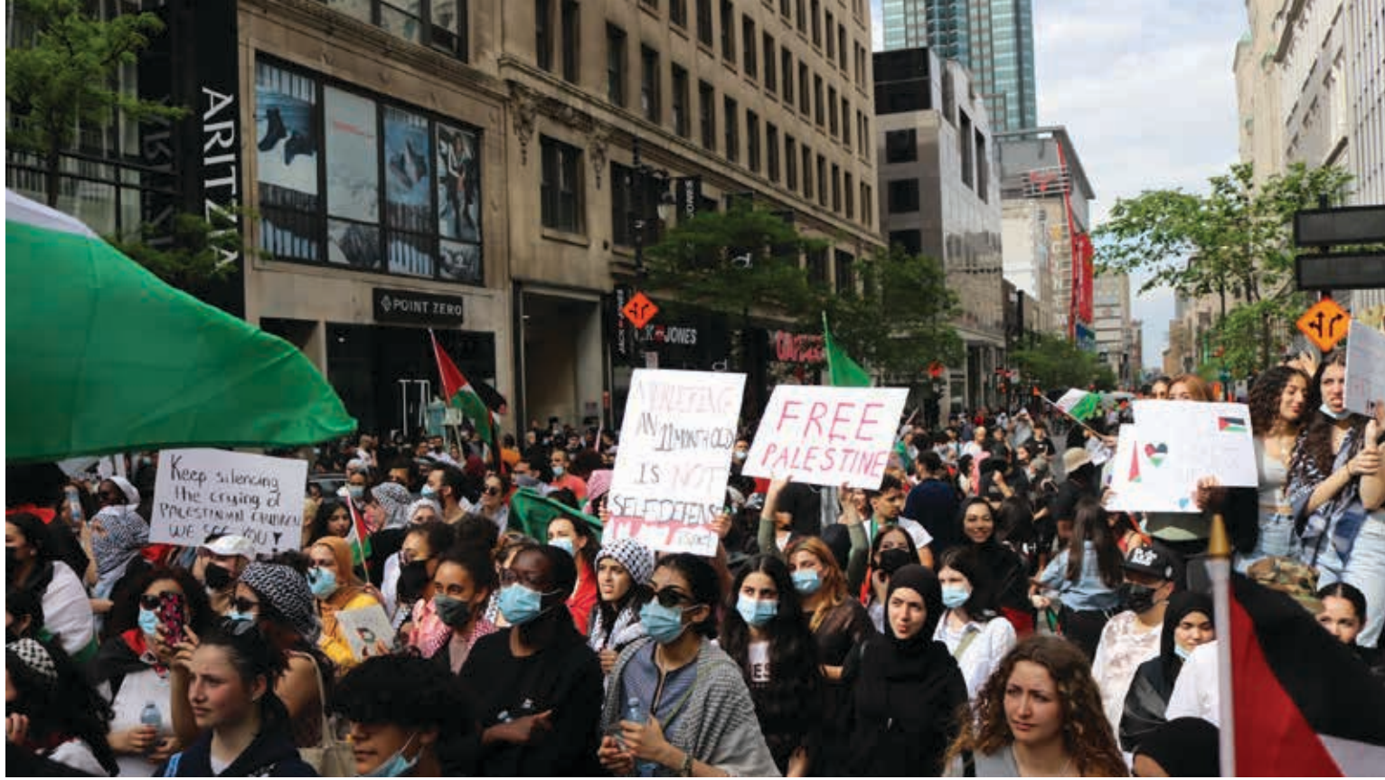
أي اعتداء أو إساءة للمتظاهرين اليهود أو غيرهم في مونتريال أو أي مدينة أخرى هو أمر غير مقبول على الإطلاق

إن أي تعرض للمتظاهرين السلميين، من أي طرف كان المتعرضون، هو أمر مرفوض ومستنكر ومُدان. كما أن أيّ اعتداء أو إساءة للمتظاهرين اليهود في مونتريال أو أي مدينة أخرى هو أمر غير مقبول على الإطلاق ويجب أن يُحاكم المتهمون لأي جهة انتصروا. فحق التعبير يجب أن يكون مُصاناً كما في شرعة الحقوق الكندية، كما يجب معاقبة المُعتدين على أي تجمع سلمي بما تنص عليه القوانين. وفي الوقت ذاته، إن أي استغلال رخيص لهذه الممارسات لحرف الأنظار عن المشكلة الحقيقية المتمثلة في الاحتلال وما قام به في حي الشيخ جراح وممارساته بحق الفلسطينيين أو محاولة تشويه التظاهرات في كندا هو مرفوض أيضاً ومُدان، كائناً من كان الذي يقف وراءه.