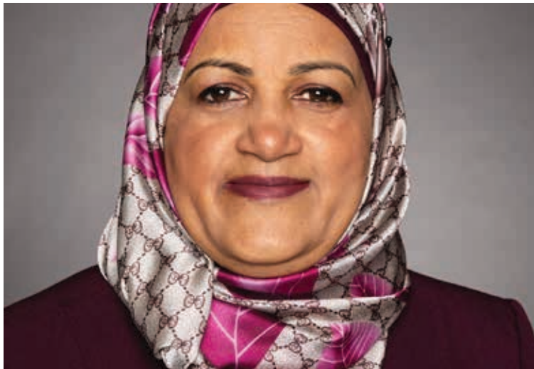
رئيس مجموعة الصداقة البرلمانية الكندية الفلسطينية النائب عن منطقة وسط سكاربورو سلمى زاهد

السناطور سلمى عطاء الله جان والسناطور محمد اقبال رافاليا والنواب سلمى زاهد، ماريو بوليو، اليزابيث ماي، ياسمينه راتنسي، شاندرأ آريا، سوخ داليوال، سوربيا مارتينز روادا، الكسندر بولريس، شون تيشن، دان ديفس ومجيد جوهرى.