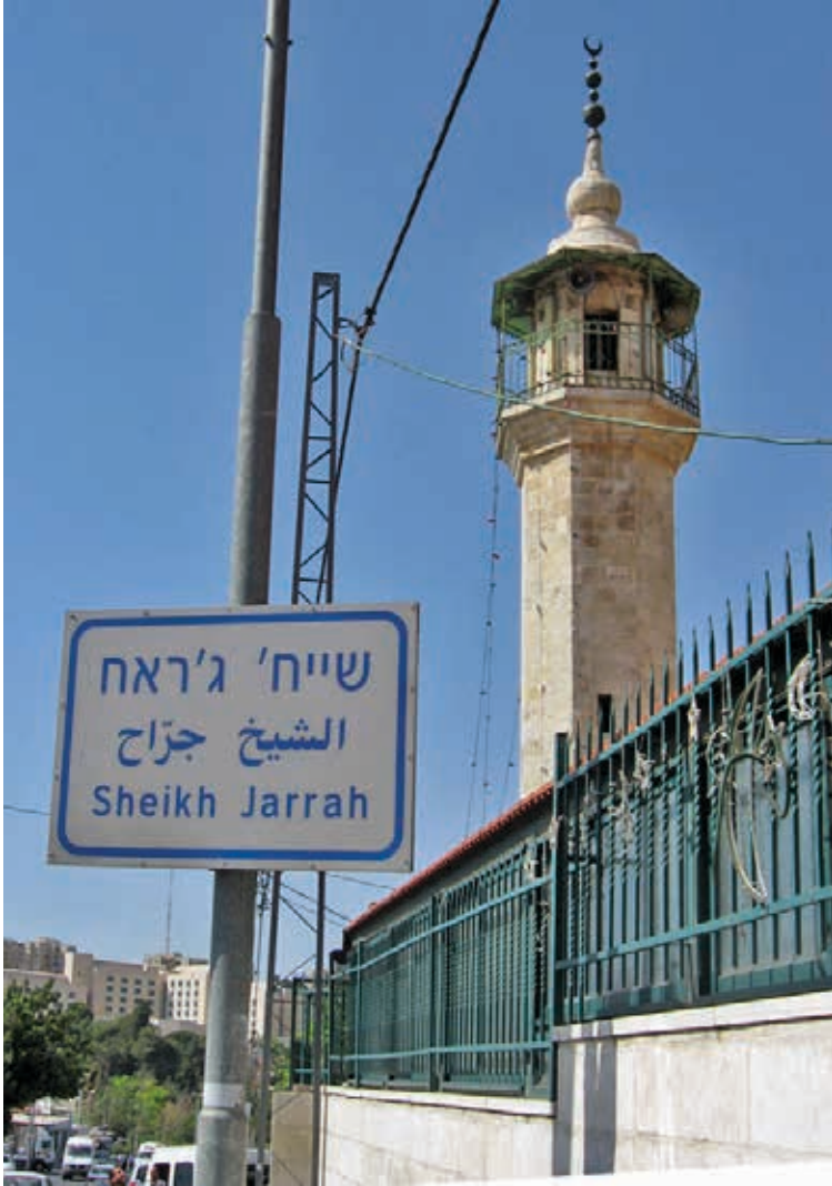
أدعو الحكومة الفيدرالية أن تحترم "حقوق الإنسان" التي من المفترض أنها حجر الأساس في الدستور الكندي!

الحياد لم يعد مقبولاً، فبيما يتم الإستنفار بكافة الوسائل والجهود لرفض أي شكل من أشكال معاداة السامية في المجتمعات الغربية، يتم غض الطرف عن معاداة الشعب الفلسطيني ومآسيه، في ظل غياب الدور الفعلي للأمم المتحدة، والإنتهاك السافر للقوانين والمواثيق الدولية!