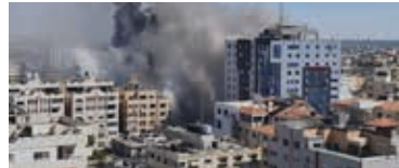
استهداف الابراج في غزة كان يتم مشاهدته بشكل مباشر

ولم تذكر تلك الفضائيات العربية نفسها السبب الرئيسي للعدوان نفسه إن الصراع الحالي يتركز حول القدس، وقد فجرته القيود التي فرضها الاحتلال المفروضة على الصلاة بالمسجد الأقصى خلال شهر رمضان المبارك ، وقضية العائلات العربية المهدة بالطرده من بيوتها في حي الشيخ جراح بالقدس، والعالم بأسره كان يشاهد كيف يعتدي الإحتلال على المصلين من نساء ورجال وأطفال .. لم يذكر التاريخ ان أي احتلال لأراضي الغير استمر . فالغلبة ستكون في نهاية المطاف لأصحاب الأرض الحقيقيين، ولو بعد أكثر من 73 عاما من الإحتلال والإرهاب والقمع .. سنتنصر ارادة الشعب الفلسطيني الباسل والإحتلال الى زوال ولو بعد حين ..