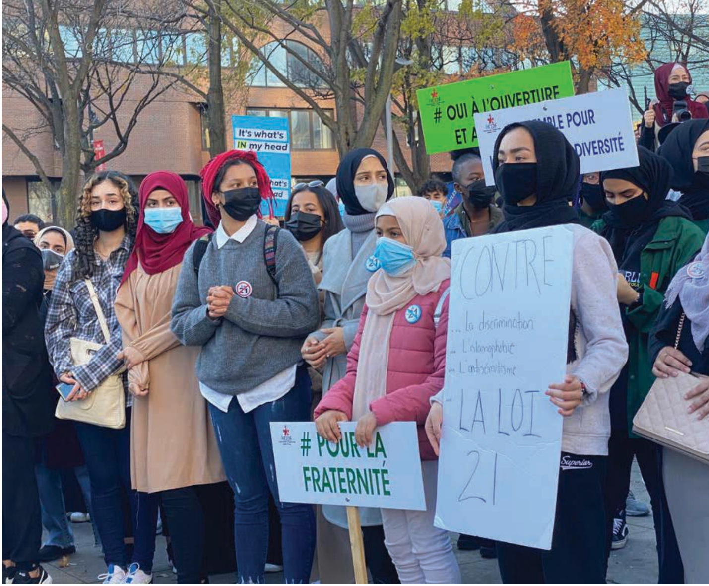
من تظاهرة ضد القانون 21 في مونتريال

المسلمين في كيبك بلغ ربع مليون، يُضاف إليهم مئات الآلاف من اليهود والسيخ والمسيحيين، الذين حُرِّموا من ممارسة حرية اختيارهم تطبيق تعليمات دينية لا تتعارض مع حقوق الآخرين بأي شكل من الأشكال.