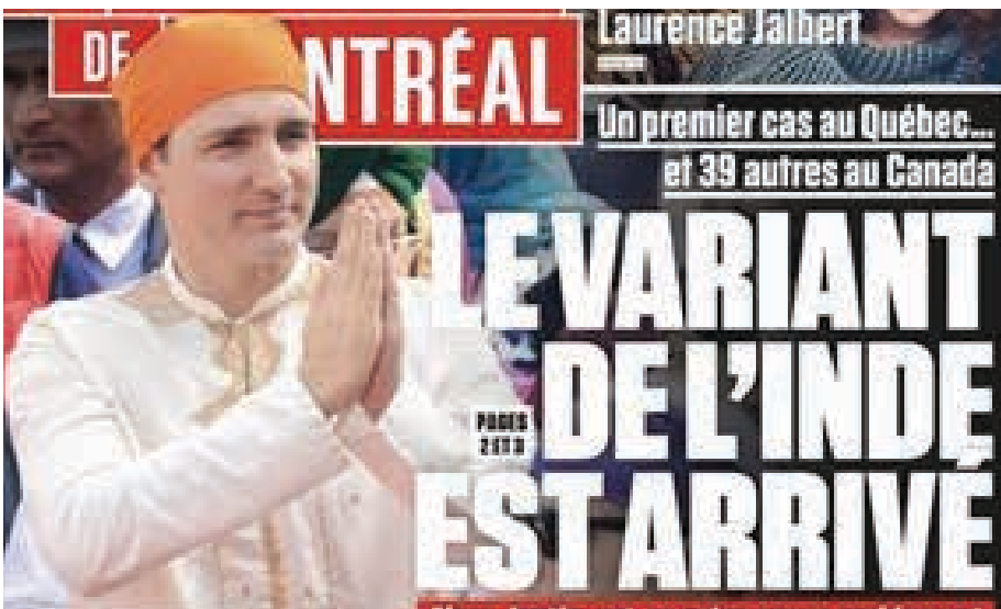
الصفحة الأولى من جورنال دو مونتريال

شاريت أن كلام الجريدة مقلق ومُدان، وأعرب عن قلقه من العواقب، موضحاً في حديثه عبر تويتر: "شهدنا ارتفاعاً في الإعتداءات العنصرية التي يتعرض لها (الكنديون) صينيو الأصل منذ بداية الجائحة. وبتصوير الأمور بهذا الشكل، يُخشى أن يزداد التعصب". يُذكر أن ترودو ارتدى الزي الهندي التقليدي الظاهر في الصورة لدى زيارته الهند عام 2018، وقد طالته إنتقادات كثيرة حينها لارتدائه الزي.