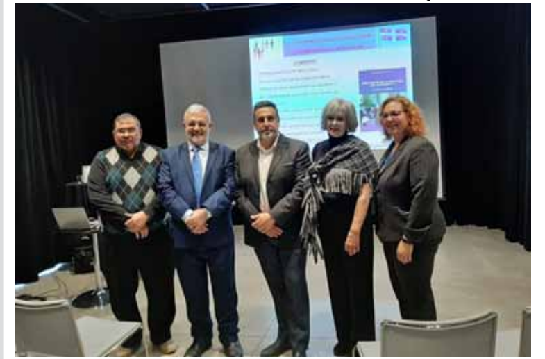
من النشاط في بلدية بييرفون