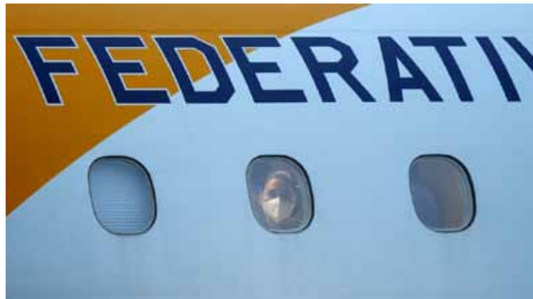
طائرة برازيلية تنقل مواطنين برازيليين من الصين

في رد فعلها على انتشار الفيروس. وكانت الولايات المتحدة أعلنت الجمعة حال طوارئ صحية ومنعت غير المقيمين القادمين من الصين مؤقتاً من دخول أراضيها. كما أوصت مواطنيها بعدم زيارة الصين ومغادرتها في حال كانوا موجودين فيها.