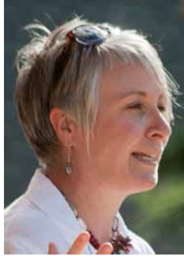
وزيرة الصحة الفدرالية باتريسيا هاجدو

للكنديين محدوداً، ونحن مهيؤون جيداً للتعامل مع هذا الفيروس في كندا، ففي المستشفيات أنظمة تحكم قوية وتدابير يُعمل بها للحد من انتشار المرض وحماية الجهاز الطبي.