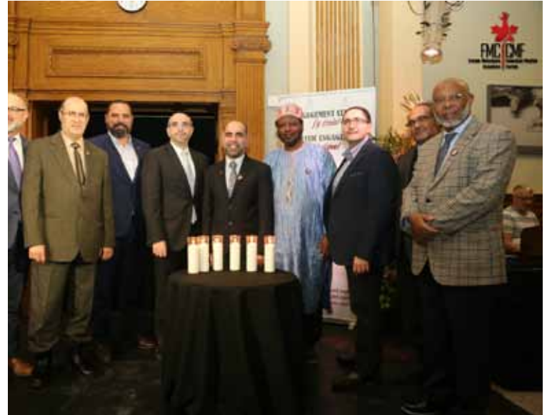
من النشاط في بلدية بييرفون

مجتمعنا لبعض الوقت مجموعة من الأعمال البغيضة والإجرامية، ورهاب الإسلام، ومعاداة السامية، والتنميط العرقي، وقتل النساء... وختم بالقول «لست متشائماً بأي حال من الأحوال، بل على العكس تماماً، فمن خلال توحيد الجميع - النساء والرجال، المونترياليون، الكيبيكيون والكنديون، ومن خلال وجود قادة سياسيين أقياء كالسيدة بلانت وآخرين على مستوى المقاطعة وفي أوتواوا، فمتأكد من استطاعتنا إحداث فرق وتوجيه رسالة قوية مفادها أن لا مكان للكره والتعصب في أوساطنا».