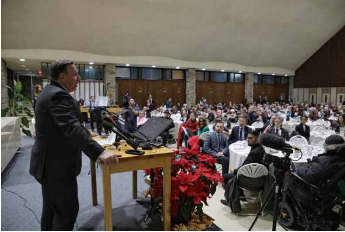
ليغو متحدثاً في احتفال الذكرى الثالثة لمجزرة كيبك في المدينة

المباشرة التي يتعرض لها المواطنون تجعلنا نخشى من العودة إلى الأجواء التي كانت سائدة في كيبك قبل وقوع مجزرة كيبك والتي ساهمت بلا شك في وقوع هذه المجزرة.