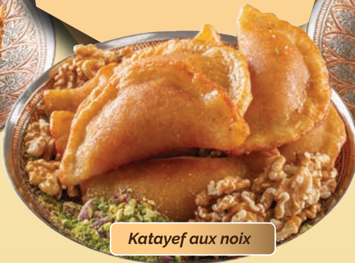
Katayef aux noix