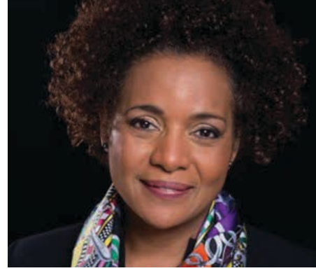
الحاكمة ميكاييل جان

منذ ثمانية أشهر وجامعة تورنتو تواجه تداعيات قرارها بحق المحامية عن حقوق الإنسان والأستاذة فالتينا أزاروفا.