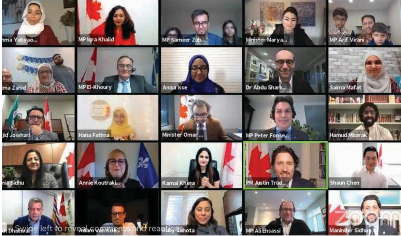
صورة من موقع زوم عن افطار النواب المسلمين في الحزب الليبرالي