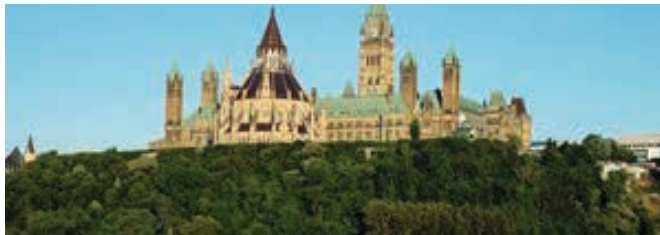
٥٠ المجلس النيابي الكندي

الجرثومية، أصبح فعلاً من الأوضح أن الحياة في كندا ترتبط ارتباطاً وثيقاً بالشؤون الدولية. من الضروري أن توضح الحكومة القادمة كيف ستوجه علاقاتها الخارجية في السنوات القادمة. فبعد فشل كندا في حيازة مقعد لدى مجلس الأمن الدولي ثانية في غضون عقد من الزمن قد يشير إلى أن حضورها العالمي بدأ بالتراجع. ومع تقلب النظام الدولي، تحتاج كندا إلى آلية لمواجهة تحديات القرن الواحد والعشرين.