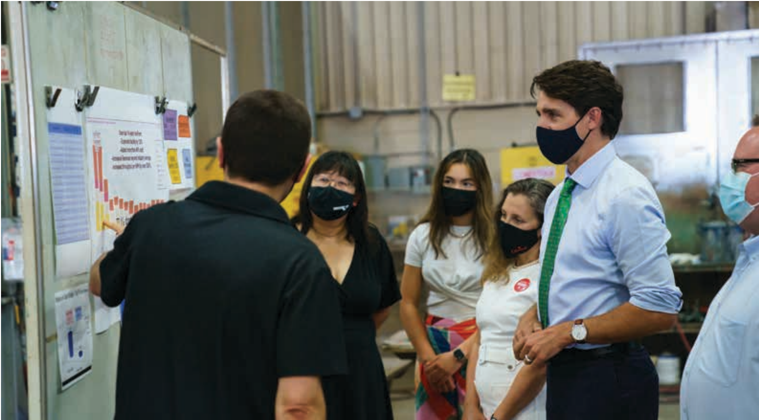
ترودو خلال جولة انتخابية على مصنع VeriForm في أونتاريو