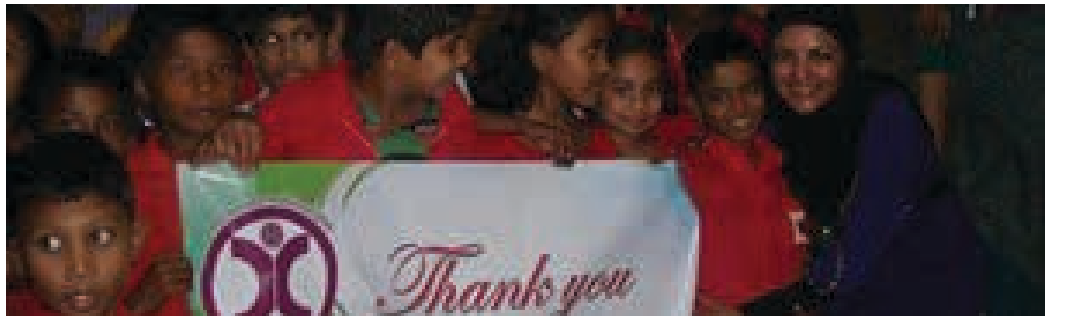
التفاصيل في الصفحة 11