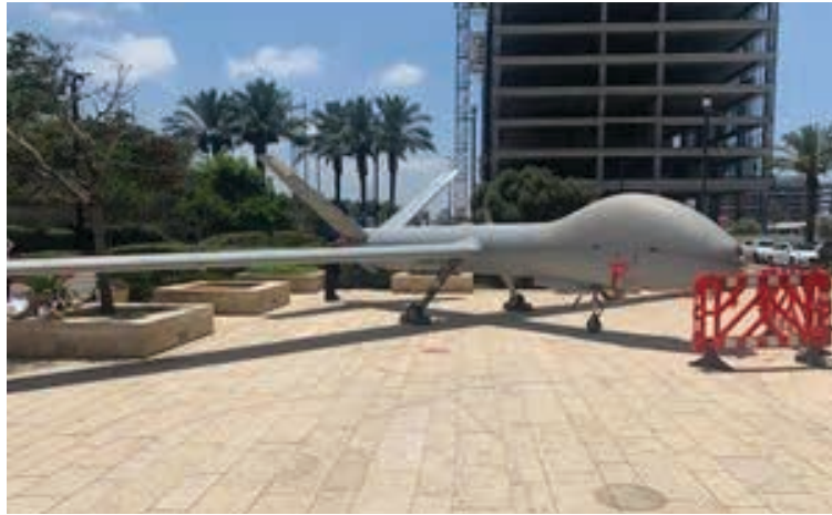
في الصورة طائرة مسيّرة صنعها شركة "Elbit Systems" الإسرائيلية

أن تتاجر في الأسلحة مع البلاد التي سجلها معروف بخرق حقوق الإنسان؟ هنا يُذكر أن كندا أبرمت عقداً بقيمة 36 مليون دولار مع شركة "Elbit Systems" الإسرائيلية التي تُستخدم طائراتها المسيّرة لقصف غزة. ثانياً: مُنتجات المستوطنات إن كنتم ممثلي لدى الحكومة، هل ستؤيدون منع استيراد مُنتجات المستوطنات غير الشرعية؟