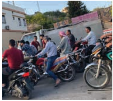
ينتظرون دورهم لتعبئة البنزين في إحدى محطات لبنان

ليست المشكلة هنا ولكن عندما تواجه اناسا عربا ويقولون امامك بان كل ما يجري في عالمهم المفترض انه يحتوي عليهم واقاربهم واصدقائهم ومسقط رأسهم ، تصبح الكلمة المتداولة عند البعض وعلى المبدأ الكندي نفسه ولكن بلغة عربية هذه المرة : ( آخر همي ما يجري. المهم اني هنا انعم بالامان والعيش الرغيد وكل ما عدا ذلك يردد امامك مرارا وتكرارا نفس الجملة : ( آخر همي ) .