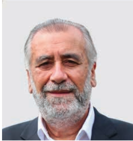
التفاصيل في الصفحة الثانية