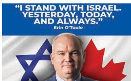
أوتول: "لطالما ساندت إسرائيل، وما زلت أفعل، وسأستمر دائماً في مساندتها".

وفقاً لمنصته الانتخابية، يتعهد زعيم الحزب الديمقراطي الجديد جيمت سينغ أنه في حال انتخابه رئيساً للحكومة سيوقف مبيعات كندا من الأسلحة لإسرائيل إلى أن تنهي احتلالها غير الشرعي (في الأراضي التي تعترف الأمم المتحدة بفلسطينيتها). أما إرن أوتول زعيم المحافظين فتقتضي منصبه الانتخابية قطع المساعدات عن اللاجئيين الفلسطينيين، وتأييد مخطط إسرائيل بالنسبة لضم القدس الشرقية إليها، ومنع النقد الموجه لإسرائيل في الأمم المتحدة، واعتراض تحقيق "محكمة الجنايات الدولية" (ICC) في الجرائم الحربية الإسرائيلية.