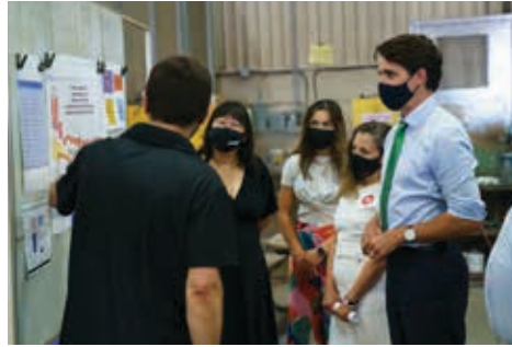
Trudeau during a campaign tour visit to the VeriForm plant in Ontario

However, another issue, the activist points out, has been worrying many among our community, and it's no less dangerous than Islamophobia: Canada's official endorsement of the IHRA's definition of anti-Semitism, which treats any criticism targeting Israel as anti-Semitic, and therefore intimidates activists acting to counter Israel's aggressions against Pal-