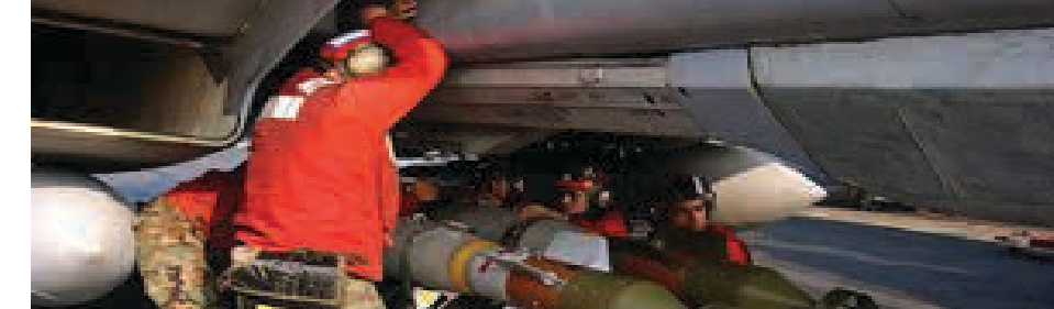
في الصورة تظهر مجموعة من الصواريخ الموجهة بحوزة الجيش الأمريكي، وهذا هو النوع الذي استخدم لقتل الأطفال اليمنيين على متن حافلتهم المدرسية عام ٢٠١٨.