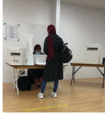
المشاركة في الانتخابات ضرورة

إذا ما استطعنا أن نسجل حضوراً قوياً في هذه الانتخابات بعد خروجنا بأعداد كبيرة، سواء صوتنا لهذا الحزب أو ذلك، فلا شك سيكون لهذا الخروج دويّ مسموع عند أهل القرار وستتردد أصداؤه في الدوائر السياسية كافة، عند من يريدنا أو من لا يريدنا ولا نريد