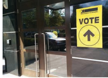
في العشرين من شهر ايلول الجاري..