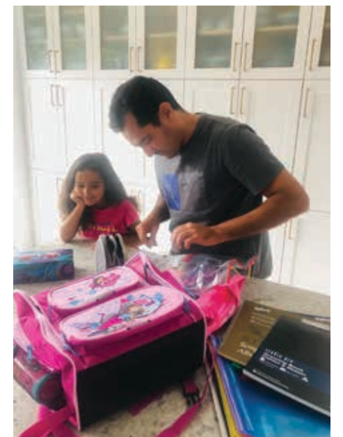
الصورة المرخصة كان نشرها النائب منصف دراجي في التاسع والعشرين من شهر آب الماضي وكتب فوقها: اليوم هو آخر فحص على حقيبتها وهي تسعى لرؤية كل شيء ونفحص كل شيء لأنها تقول لي بكل فخر "الفتيات الكبيرات اللواتي لا يذهبن إلى الحضانة بحاجة إلى التنظيم".

وكان اجتمع الحزب الليبرالي المحلي هذا الأسبوع في مؤتمر انتخابي في أورفورد، إستري، من أجل التحضير لبدء الدورة البرلمانية التي تنعقد يوم الثلاثاء. كان جواز التطعيم ضرورياً لحضور النشاط لكل من الموظفين السياسيين والصحفيين.