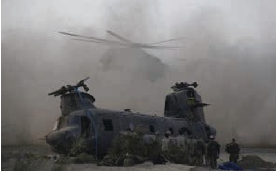
طائرة أميركية من طراز "CH-53E" تحط لمساعدة فريق طائرة كندية مُسقطَة (من طراز "CH-47E")، بتاريخ ١٧ أيار ٢٠١١

إذاً "فالحرب على أفغانستان كانت لمصلحة قطاع التسليح، ولتوسيع الجيش الكندي، وتغطية الفرار الكندي بشأن العراق، لا لتحسين حياة الناس في هذا البلد الآخر، لذا لا بد من تقليص قوة الجيش وشركات السلاح والمؤسسات التي تشاركها في توجهاتها"... وقد زعم الزعيم الأسبق لحزب الأحرار ميشيل إنياتييف (Michael Ignatieff) مرة أن "أفضل آمال الأفغانيين لتجصيل الحرية يكمن في خوضهم تجربة مؤقتة من الحكم الإستعماري". غير أن السنوات العشرين الماضية أظهرت أن الحكم الإستعماري لا يكتفي بالقليل ولا يوصل إلى الحرية أبداً، وأن أفضل الآمال يكمن في تحدي الإستعمار ودعم الإستقلال الذاتي".